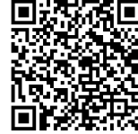
Statuten vom 16. Februar 2024