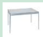
Art. 460000 Tisch weiss, Füsse Alu 123 x 83 x 75 cm (B x T x H) CHF 84.00