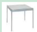
Art. 460005 Tisch weiss, Füsse Alu 83 x 83 x 75 cm (B x T x H) CHF 80.00