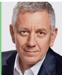
Röbi Koller , der bekannte Fernseh-Moderator, führt durch das Forum «Schiff Ahoi!».