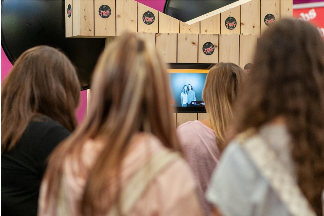
Spielerisch zum Traumberuf: Interaktiv setzen sich Jugendliche mit ihrer Berufswahl auseinander.