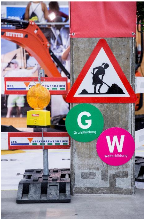
Das diesjährige Schwerpunktthema liegt auf den Berufen des Bauhauptgewerbes.