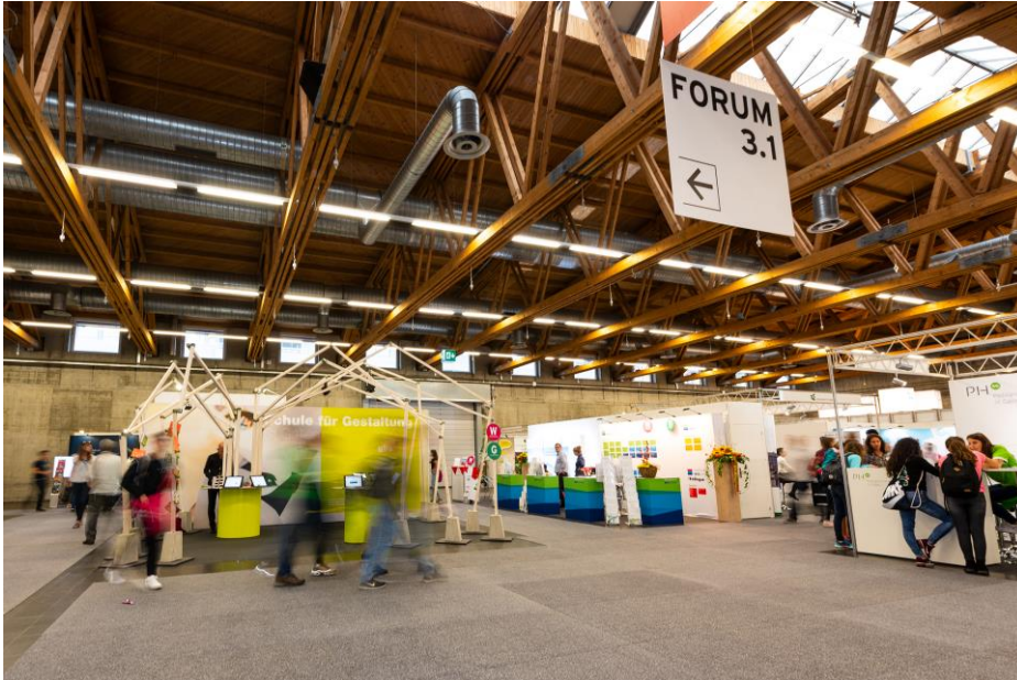
Die Hallen füllen sich: In den Olma Messen St.Gallen findet vom 30. August bis 2. September die OBA statt.