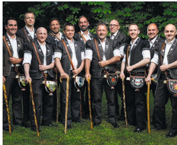
Die Sennen des Fête des Vignerons 2019

Der Festakt am Nachmittag stimmt so richtig ein auf das kommende Winzerfest im Sommer 2019 in Vevey. Die Zuschauer dürfen sich auf die musikalischen Auftritte des Orchesters «La Lyre de Vevey», der Trychlerformation «Les Sonneurs de cloches du Pays-d'Enhaut» oder der Sennengruppe «Armaillis» freuen. Umrahmt wird der Festakt durch die Grussworte der St.Galler Regierung sowie der Organisatoren des «Fête des Vignerons 2019».