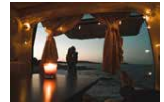
Halle 9.1 Camping und Abenteuer