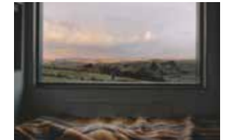
Halle 3.1 Weltwunder und Neuland