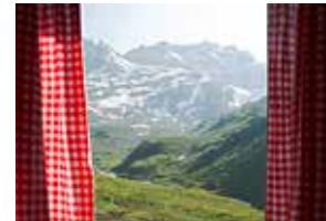
Halle 2.1 Alpenluft und Sein

Können Sie den Freizeithunger unserer Besucher stillen? Sind Sie ein Experte für unvergessliche Tagesausflüge? Haben Sie Tipps für Abenteurer und Adrenalin-Junkies? Dann ist Ihr idealer Standplatz in der Halle 2.0 oder 2.1 . Gerne beraten wir Sie auch zu den anderen Hallen.