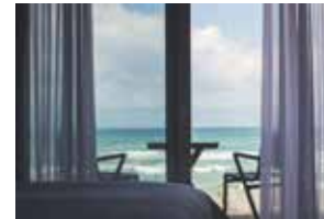
Halle 3.0 Sonne und Mehr