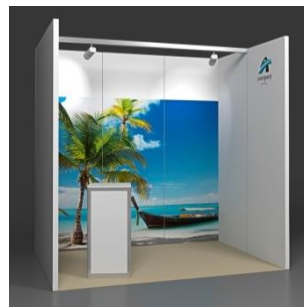
Fresh 6 m 2 Reihenstand mit Grafikdruck