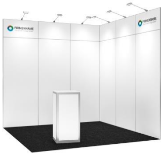
Fresh 9 m 2 Eckstand