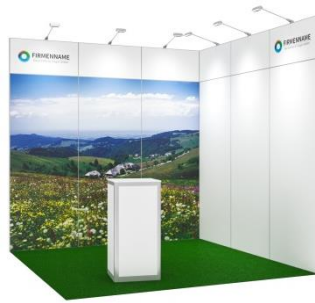
Fresh 9 m 2 Eckstand mit Grafikdruck