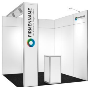
Fresh Plus 9 m 2 Eckstand

Beispielhafte Visualisierungen des Standtyps Fresh Plus: