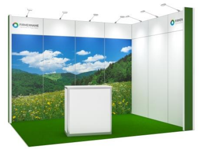
Fresh 12 m 2 Eckstand mit Grafikdruck