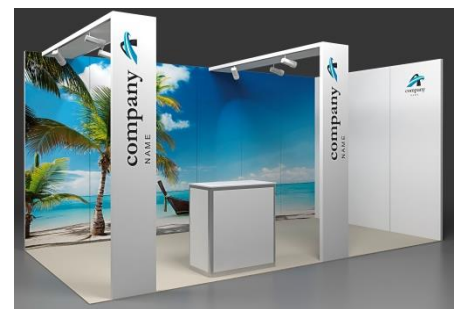
Fresh Plus 18m 2 Eckstand mit Grafikdruck