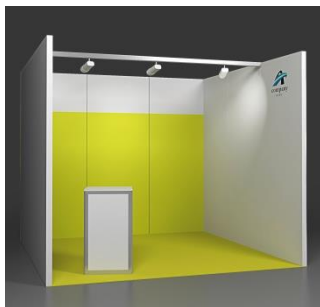
Fresh 9 m 2 Reihenstand mit farbiger Rückwand