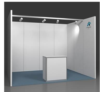
Fresh 12 m 2 Reihenstand