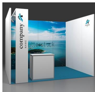
Fresh Plus 9 m 2 Eckstand mit Grafikdruck